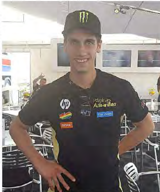
Alex Rins nada más concluir la entrevista ayer en el circuito de Jerez.

¿Que sensaciones ha tenido durante los entrenamientos del fin de semana en Jerez?